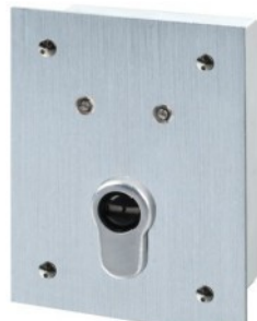
ohne Profil Halbzylinder