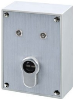
ohne Profil Halbzylinder